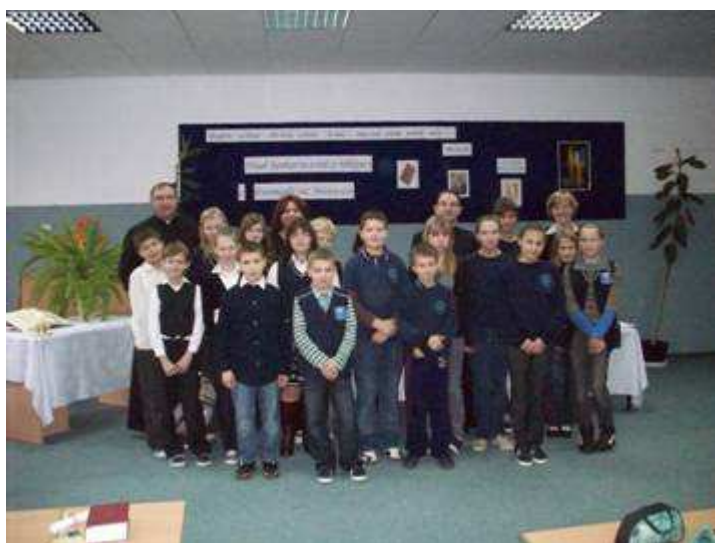
Oto zdjęcie z Międzyszkolnego Konkursu Biblijnego 20008